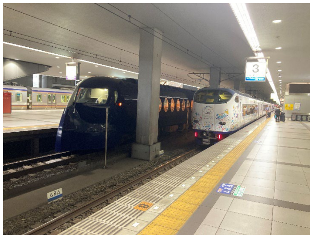
「ラピート」・「はるか」が並ぶフォトセッション会場イメージ

ホームへの入場には、入場券または乗車券等が必要です。 また、混雑の状況により入場を制限する場合があります。