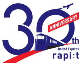
特急「ラピート」運行開始 30 周年記念ロゴ